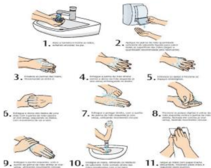
Figura 1: Procedimentos para lavagem das mãos